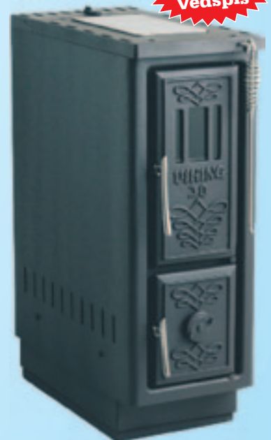
VIKING 30 13.900:-

Byt till luftvärme och din gör något roligare för dina värmepengar!