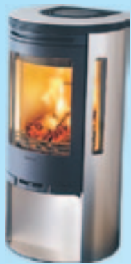
Contura 550A Kampanjpris 17.900:- Spara 4.000:-