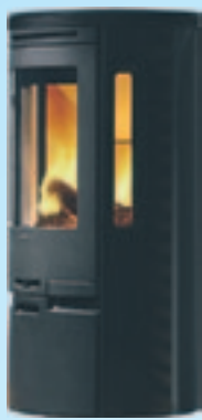
Contura 570 Kampanjpris 17.900:- Spara 4.000:-