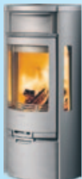
Contura 655 Kampanjpris 18.900:- med valfri överdel Spara 4.600:-