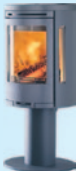
Contura 585 Kampanjpris 16.900:- med valfri överdel Spara 2.600:-