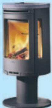
Contura 580 Kampanjpris 16.900:- med valfri överdel Spara 2.600:-