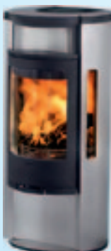
Contura 655A Kampanjpris 22.900:- med valfri överdel Spara 4.360:-